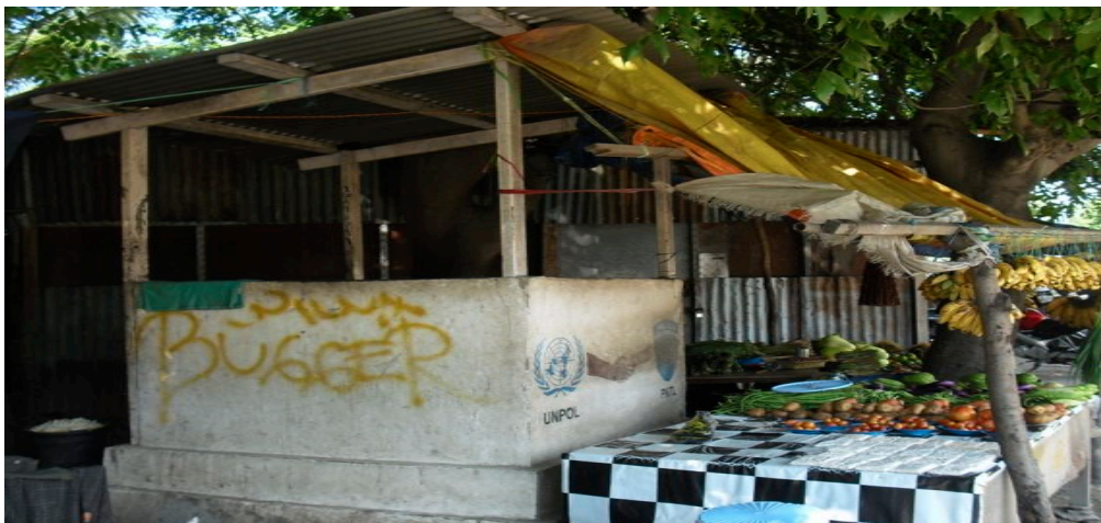
tinan 2015.